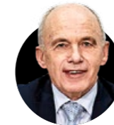
Ueli Maurer Der Finanzminister ortet zu Beginn der Corona-Krise Handlungsbedarf.